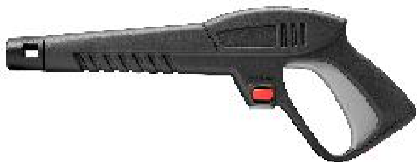
PISTOLA S'10Y CON ATTACCO RAPIDO INTEGRATO - COD. 6.001.0079