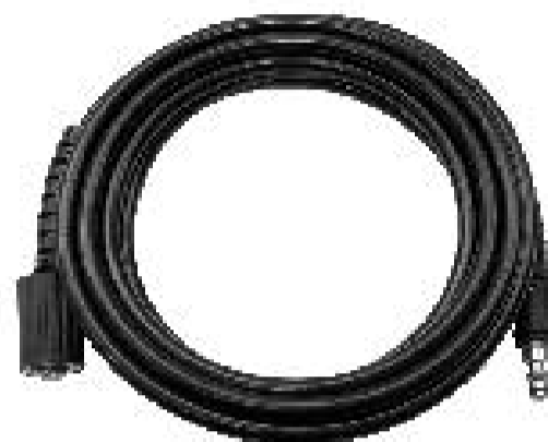
TUBO 1/4 21MPa 8 METRI R1 1/4F GIRERIVOLE-M22X1,5 CON MANICOTTI - COD. 4.018.0003