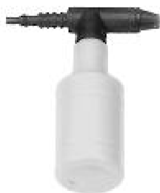
LANCIA SCHIUMA CON SERBATOIO - COD. 6.002.0162