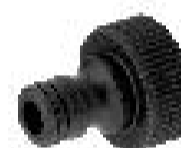
INNESTO RAPIDO 3/4 F - COD. 3.100.0082